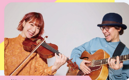
mille baisers (ミルベゼ)