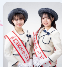
門司みなとアンバサダー