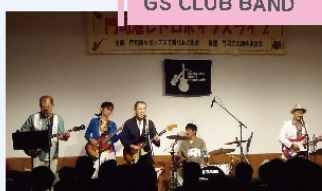
GS CLUB BAND