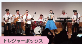
トレジャーボックス