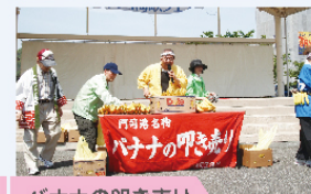
バナナの叩き売り