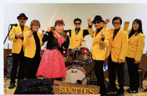
シックスティーズ