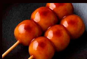
ベースぼむ〜甘味〜 BaseBomb~KANMI~ 団子と茶漬け Dango & Chazuke