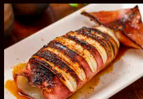
JJKitchen JJKitchen 海鮮チヂミ、イカ焼き Seafood Korean pancake, Grilled Squid