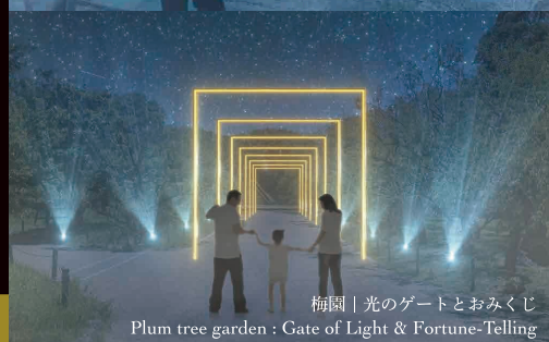
梅園 | 光のゲートとおみくじ Plum tree garden: Gate of Light & Fortune-Telling