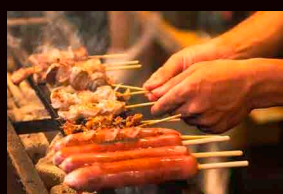
炭家108 SUMIYA108 焼き鳥 YAKITORI