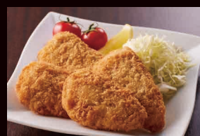
三陽食堂 Sanyo-Shokudo アジフライ、アジフライバーガー Ajifry, Ajifry Burger