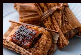
うなぎ茶屋 Ohori Unagi うなぎチマキ Unagi Chimaki

Present the card received at the Ohori Park Japanese Garden "Sora SORA" to receive a complimentary Original Goshuin-cho (Limited to the first 30 visitors daily)!