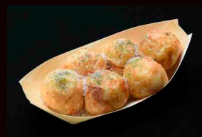
博多ソルトこ Hakatasoltako 博多ソルトこ Green seaweed and Salt Takoyaki