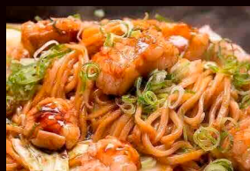
もつ焼もつ鍋 裏飯屋 motsunabe urameshiya 博多もつ焼きそば Motsu Yakisoba