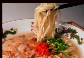
屋台のたまちゃん Yatai no Tamachan 豚骨ラーメン Tonkotsu Ramen