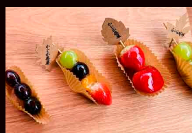
かじか茶屋 Kajika Chaya いちご飴、りんご飴、ぶどう飴など Strawberry Candy, Apple Candy, grape Candy