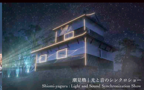
潮見櫓 | 光と音のシンクロショー Shiomi-yagura: Light and Sound Synchronization Show