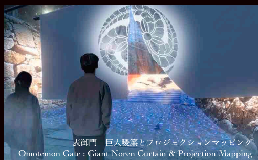
表御門 | 巨大暖簾とプロジェクションマッピング Omotemon Gate: Giant Noren Curtain & Projection Mapping