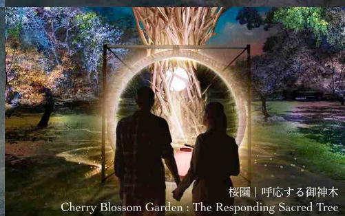
桜園 | 呼応する御神木 Cherry Blossom Garden: The Responding Sacred Tree