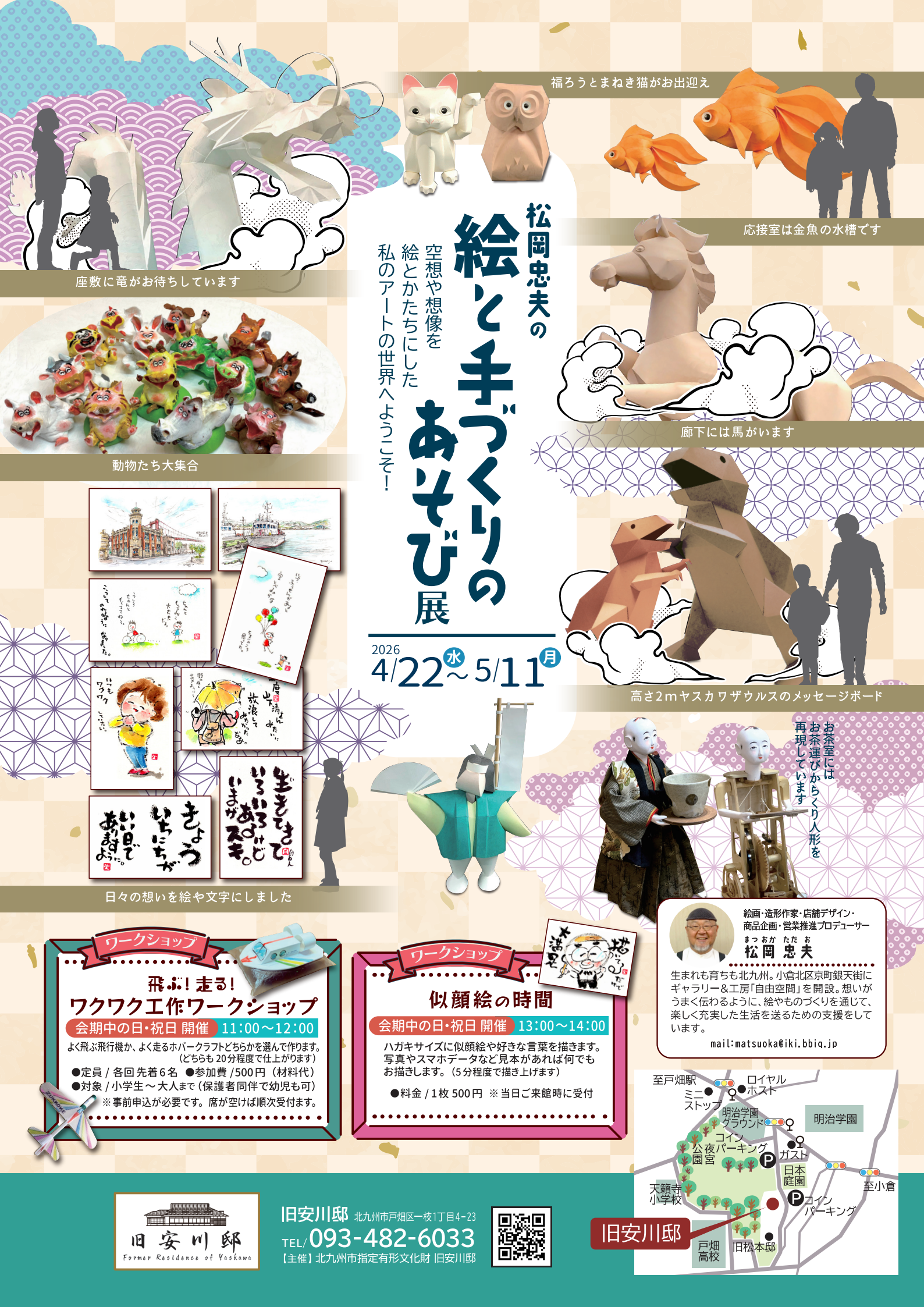
福ろうとまねき猫がお出迎え