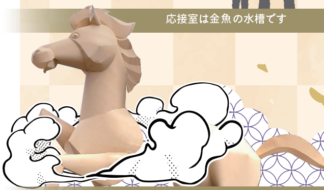
廊下には馬がいます