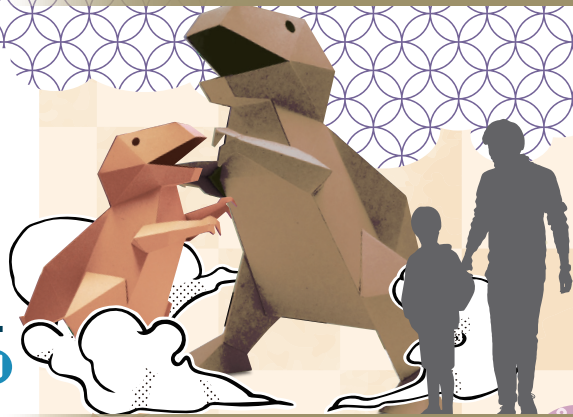
高さ2mヤスカワザウルスのメッセージボード