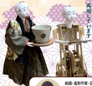
お茶室には お茶運びからくり人形を 再現しています