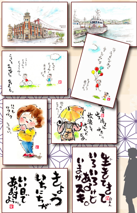
日々の想いを絵や文字にしました