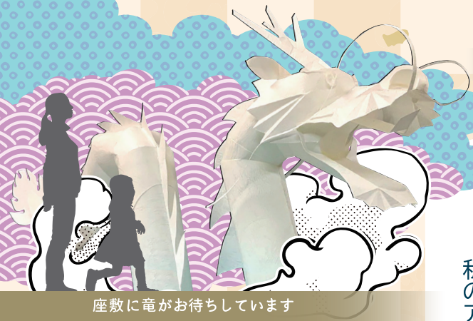
座敷に竜がお待ちしています