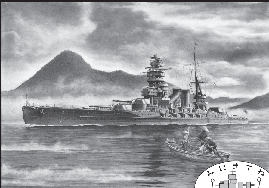
鉛筆画「憧憬—われは海の子—戦艦 長門 2588」