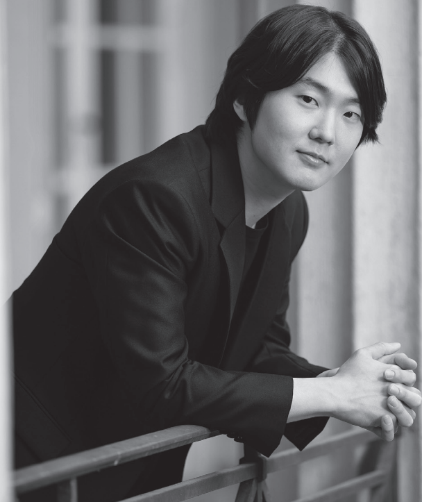
チョ・ソンジン [ピアノ] Seong-Jin Cho, Piano