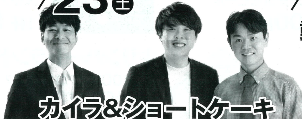
カイラ&ショットケーキ