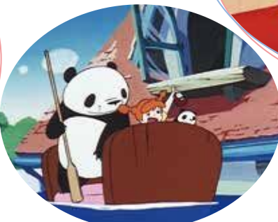
「雨ふりサーカスの巻」場面写 演出：高畑勲 原案・脚本・画面設定：宮崎駿