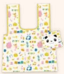
エコバッグ 1,760円(税込)