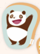
ダイカットクッション 3,080円(税込)