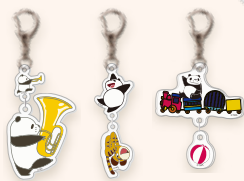
2連アクリルキーホルダー 各880円(税込)