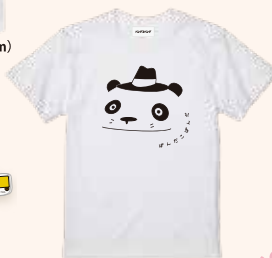
Tシャツ (S/M/L) 各3,300円(税込)