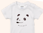
Tシャツ (110/130cm) 各3,190円(税込)