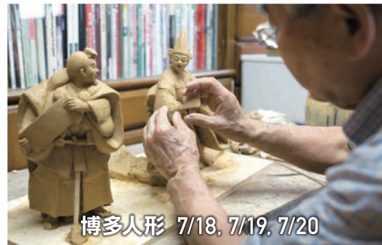
博多人形 7/18, 7/19, 7/20