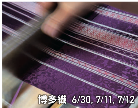
博多織 6/30, 7/11, 7/12