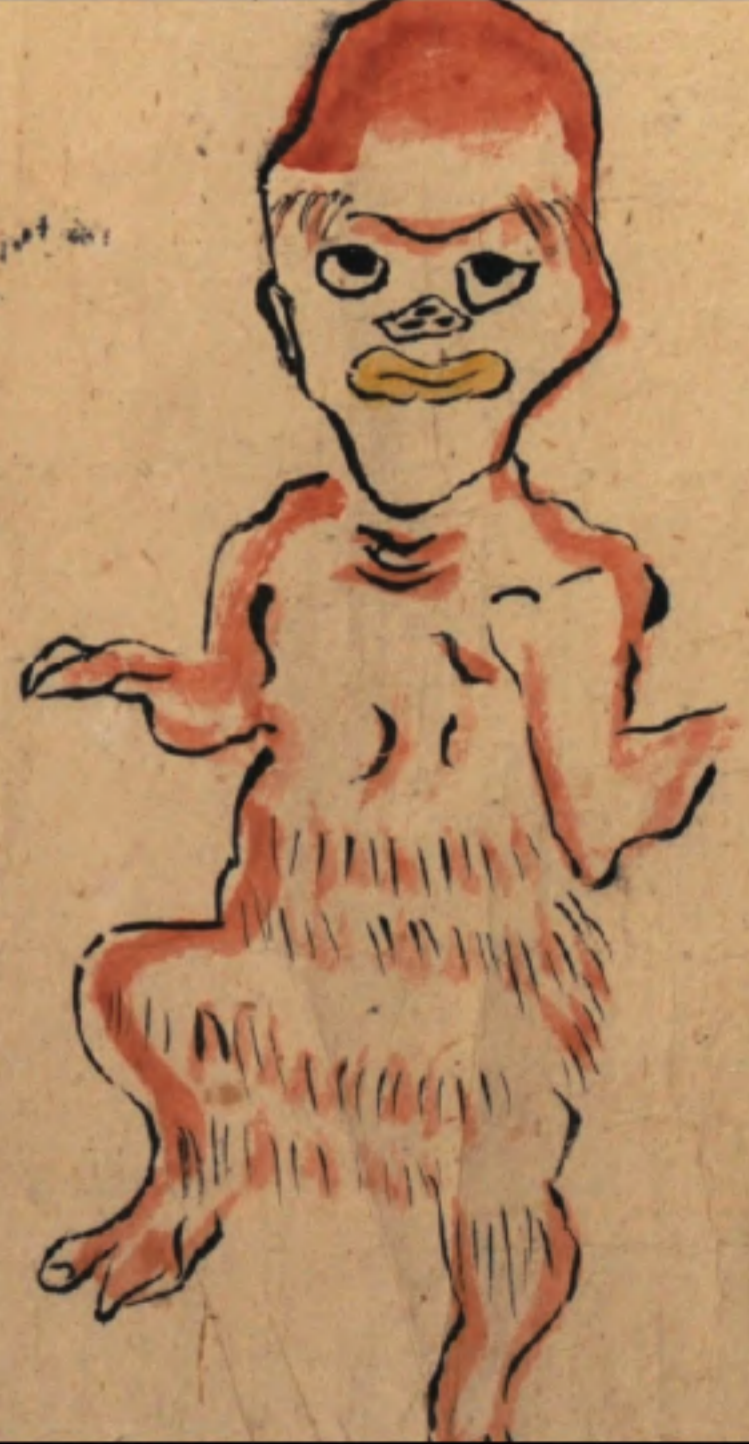
▲朝倉市指定文化財「三奈木品照寺文書」『諸国化物図巻』 (法喜品照寺蔵)より抜粋

山奥より出る長旅と号は る 倉 ー がー こき事 人 の あし 木 の を 虫 我 倉 乃 と こ 大 と 丈 の 立 直 ち ち