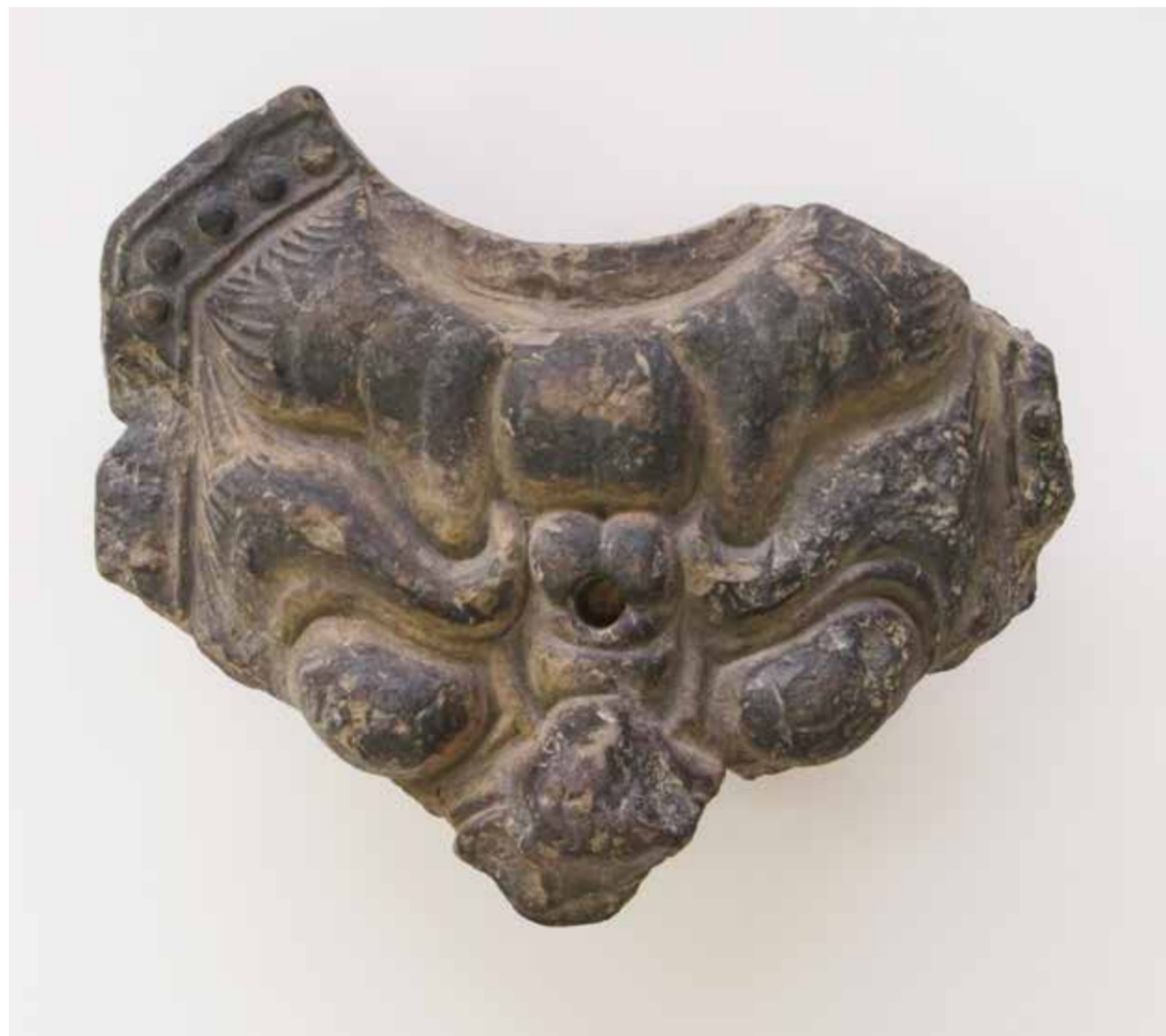
▲朝倉市指定文化財『長安寺廃寺跡出土の鬼瓦』（朝倉市教育委員会）

秋博で、不思議な世界を楽しみながら、先人たちが築き上げた豊かな想像力の歴史に触れてみてください。