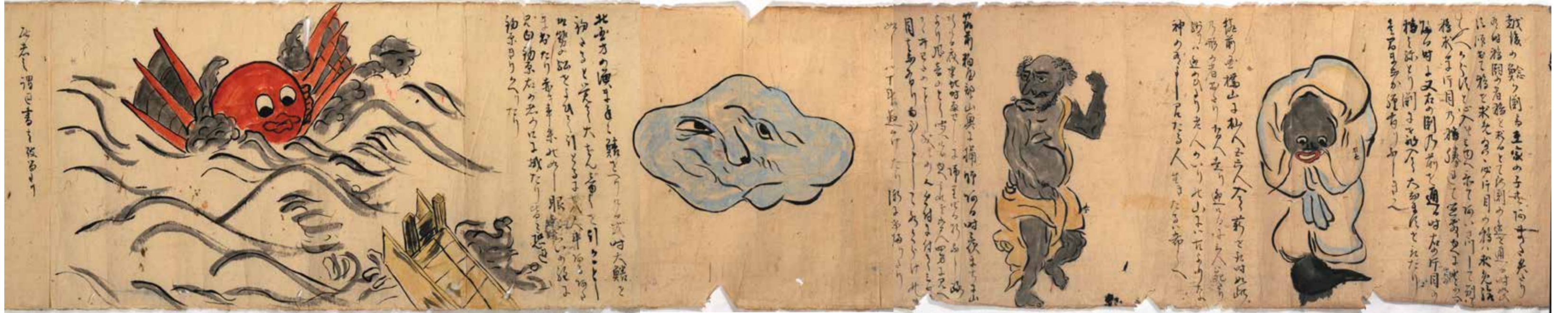
▲朝倉市指定文化財「三奈木品照寺文書」『諸国化物図巻』（法喜山品照寺寄託）