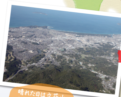
晴れた日は立花山から相島がみえる♪