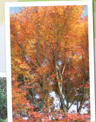
秋には紅葉がキレイ♪