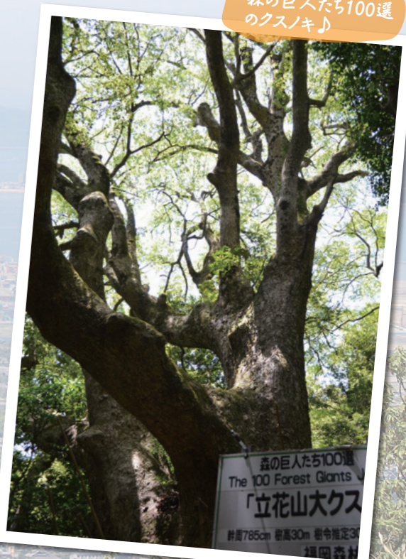
森の巨人たち100選 The 100 Forest Giants 「立花山大クスノキ」 幹周785cm 樹高30m 樹令推定300年 福岡県立花山 立花山観光協会