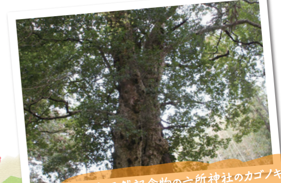
県指定天然記念物の六所神社のカゴノキ